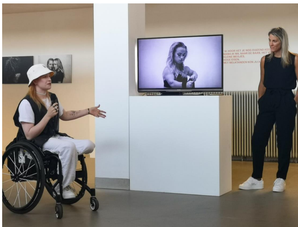
Opening expositie Laura de Mildt

In coronatijd maakte fotograaf Laura de Mildt studioportretten van zo'n 100 Nederlandse topsportvrouwen. Krachtige portretten van ambitieuze vrouwen van verschillende leeftijden en verschillende sporten. De expositie was een toonbeeld van inclusiviteit omdat De Mildt ook portretten van krachtige vrouwen met een beperking liet zien. Bij de opening heeft RTL4 opnamen gemaakt, die in de avond onderdeel waren van Shownieuws.