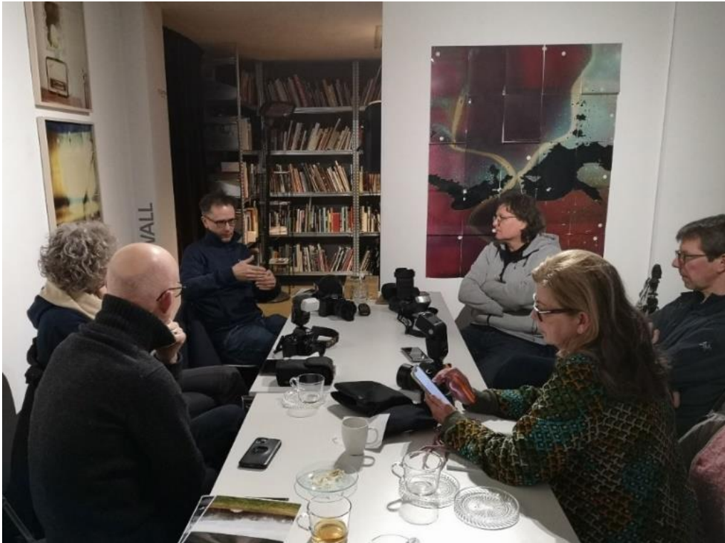
Fotoclub Contrast twee maandelijkse bijeenkomsten met de bibliotheek als inspiratiebron