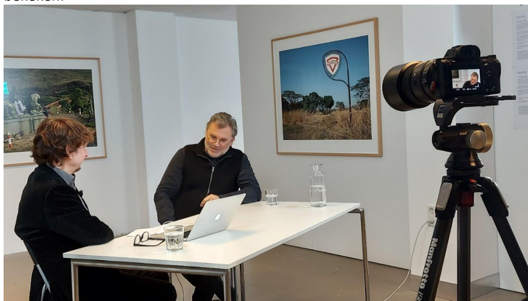
Carl De Keyzer tijdens het interview door Photo31

De Keyzer gaf tweemaal (vanwege corona werd de groep gesplitst) een lezing over zijn reizen door Congo. Ook verzorgde hij een tweedaagse masterclass over zijn werkzaamheden als Magnumfotograaf. Photo31 interviewde en filmde Carl De Keyzer te midden van zijn expositie bij Pennings; het interview werd als webinar uitgezonden en is via YouTube tot nu toe ruim 2400 keer bekeken.